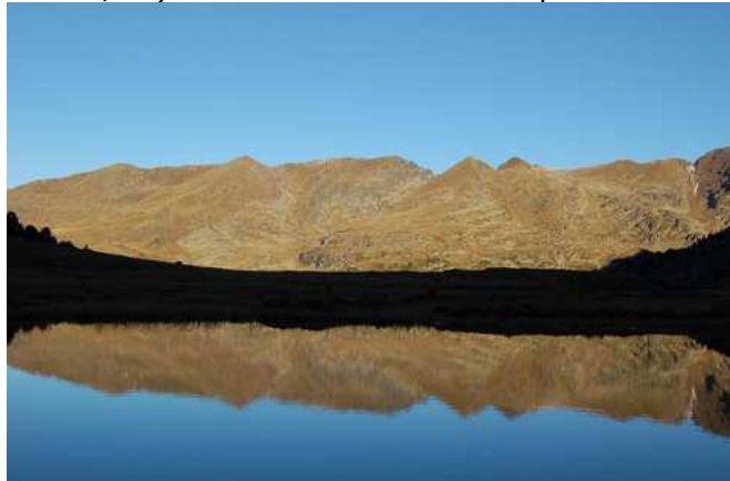
Gioco di riflessi in Vall de Siscarò

27/08: VAL DE SISCARO'. Dopo colazione si effettuerà un breve spostamento con bus di linea alla località sciistica di Soldeu, dove si inizierà a salire all'interno di un bel bosco di pini e betulle; il sentiero si inerpica attraverso una fitta foresta di pini alternati a qualche rara betulla, per raggiungere i suggestivi laghi di Baix e Siscarò, a oltre 2300mt di quota, e la sottostante Valle glaciale di Siscarò, dove è presente un piccolo bivacco montano in pietra. Si scenderà poi in Vall d'Incles, tra pascoli e antichi abitati, con limpidi corsi d'acqua che scendono dalle montagne circostanti; si ritornerà quindi a Soldeu e all'hotel (13 km - 450m disl. - 5/6 h). relax nel centro benessere prima di cena.