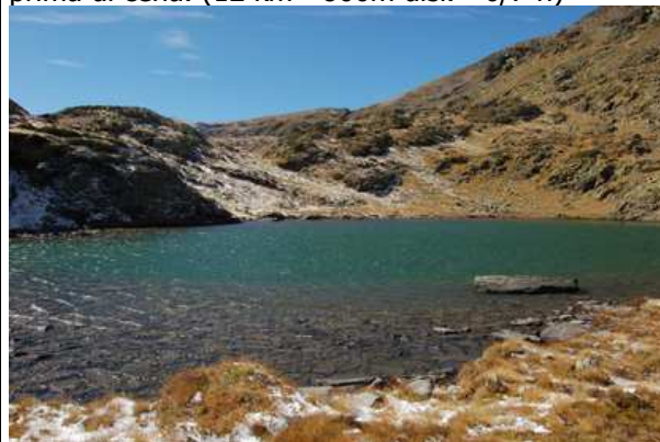
Lago nella Vall de Riù

29/08: VALL DE RIÙ. Partendo a piedi dall'albergo si raggiungerà la vicina località di Els Prat, dove si imbroccherà un sentiero montano che, fiancheggiando il versante meridionale del Pic de la Torradella, raggiungerà gli alti pascoli della Pedregosa nella Vall del Riù e un piccolo bivacco ottimale per una breve sosta a metà salita. Il percorso proseguirà tra pietraie e prati d'alta quota, fino agli incantevoli laghi montani, l'ultimo dei quali a 2500 metri di quota è un vero gioiello naturalistico. Al ritorno relax nel centro benessere prima di cena. (12 km - 800m disl. - 6/7 h)